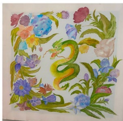
«Нежный полет весны» Ищенко Анжелика 3 курс Холодный батик 60*60 Преподаватель Сосуляникова А.А.