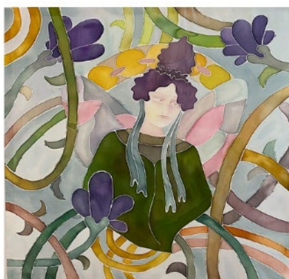
«Флора» Изаковича Вероника 3 курс Холодный батик 60*60 Преподаватель Сосуляникова А.А.